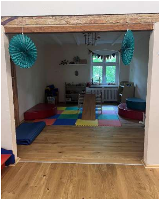
Raum 1 (EG) 20-25 m 2